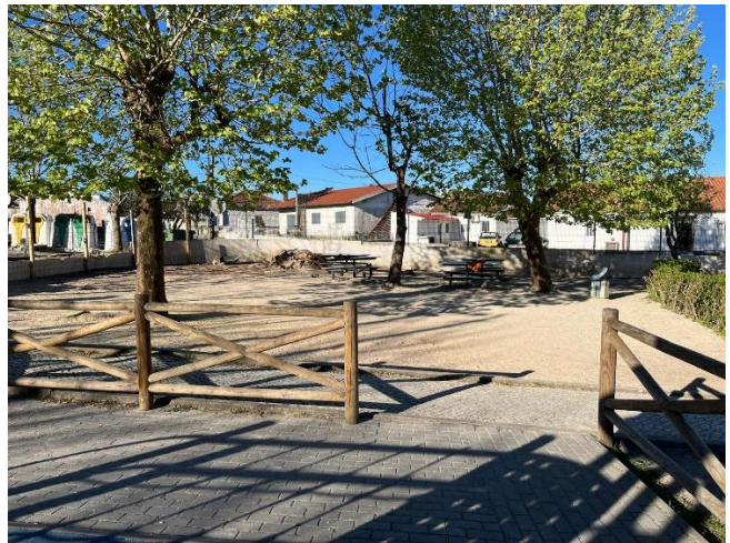
Fotos 9 e 10 – Zona de implantação da Microfloresta na Escola Básica da Moita