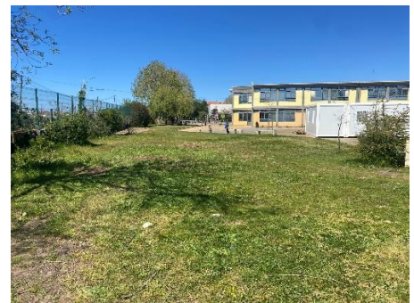
Fotos 1, 2 e 3 - Zona de implantação da Microfloresta na Escola Básica de Casal de Malta