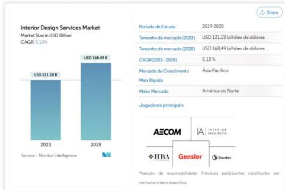
Tamanho do mercado de serviços de design de interiores

O tamanho do mercado de serviços de design de interiores deverá crescer de US$ 131,20 bilhões em 2023 para US$ 168,49 bilhões até 2028, com um CAGR de 5,13% durante o período de previsão (2023-2028).