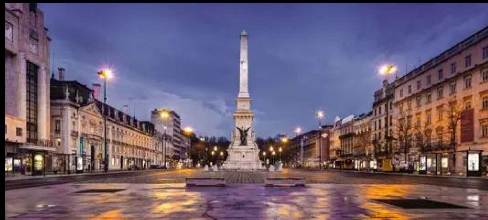
AVENIDA DA LIBERDADE