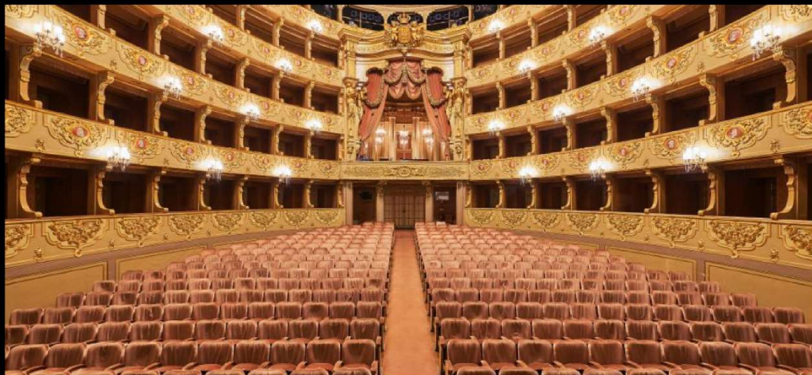
TEATRO SÃO CARLOS