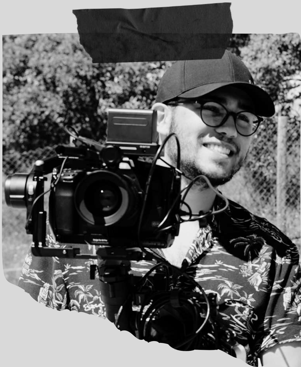
DINIS diretor de fotografia