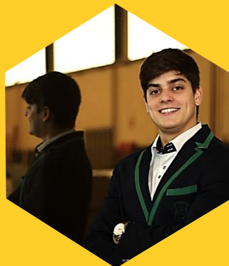
ENGENHARIA GESTÃO INDUSTRIAL