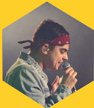
MÚSICA CARREIRA MUSICAL