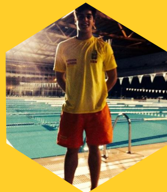
OUTROS SALVAMENTO TEATRO OUTRAS EXPERIÊNCIAS