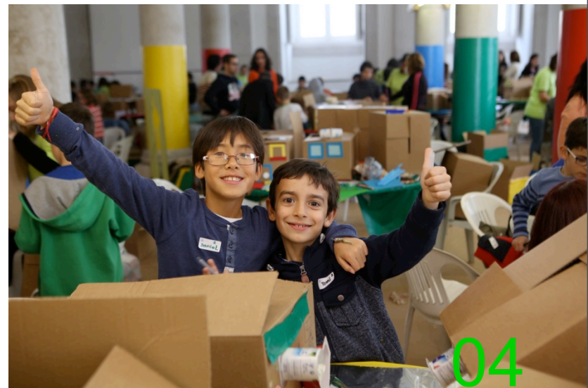
O ambiente no evento.