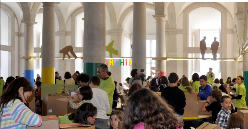
O espaço do evento: Torreão Poente do Terreiro do Paço, Lisboa.