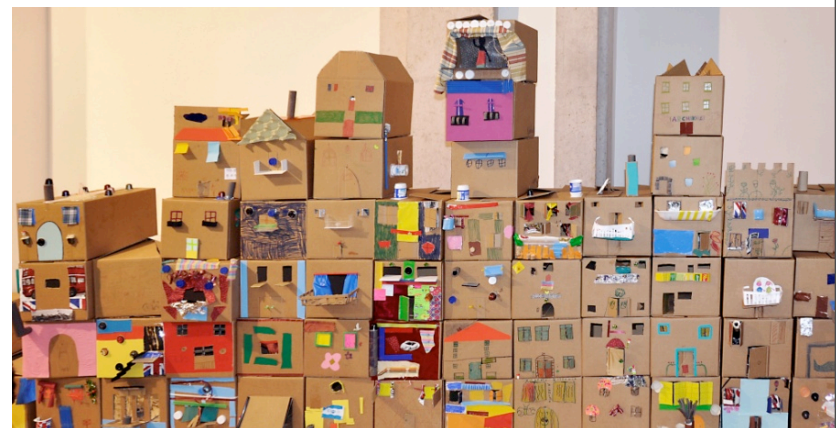
Resultados finais – maquete colectiva.