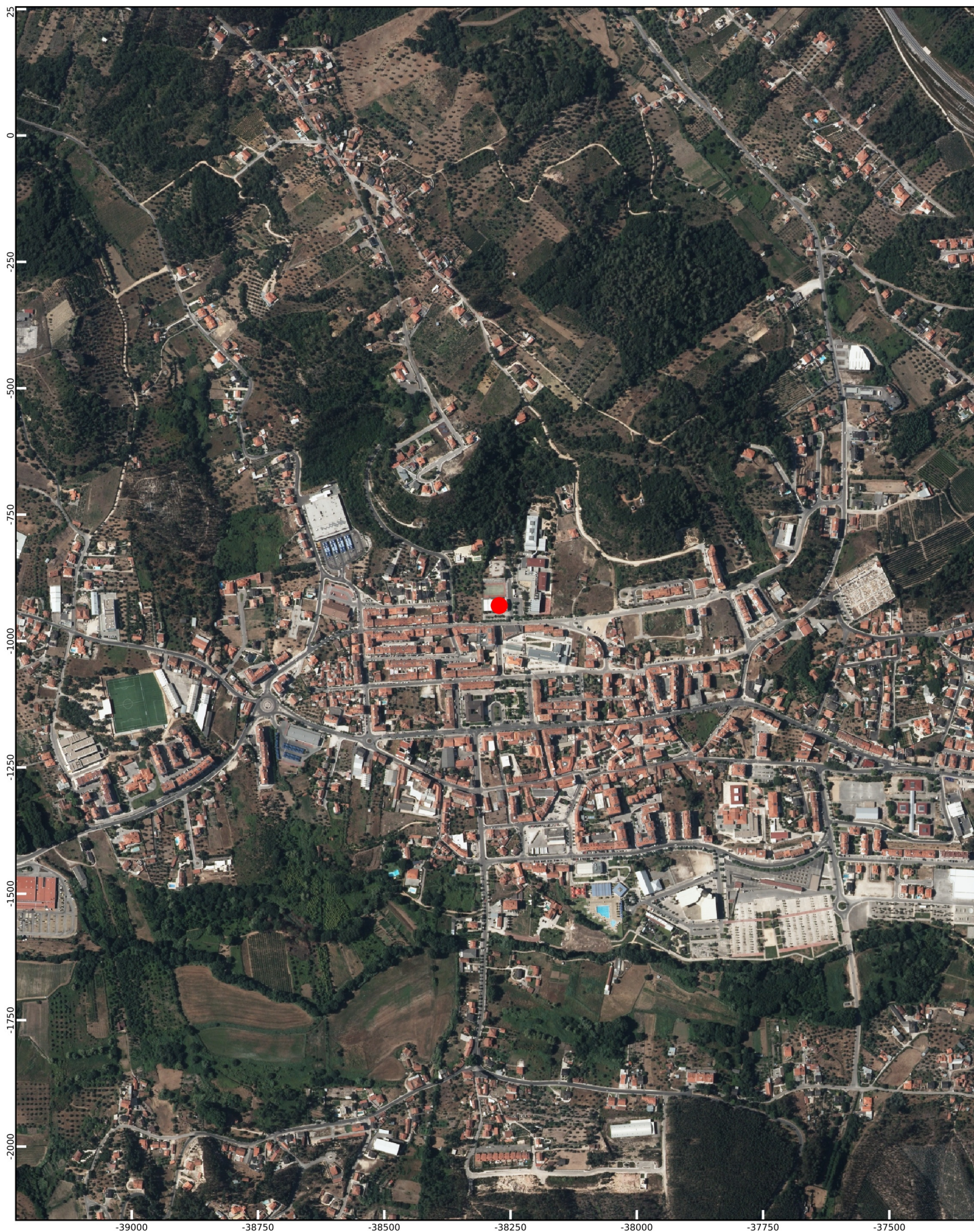
Planta produzida pelo utilizador a partir de um portal geográfico do município, servindo apenas de referência.

Praça D. Maria II, nº 1 2490-499 Ourém telf: 249 540 900 fax: 249 540 908 e-mail: geral@cm-ourem.pt