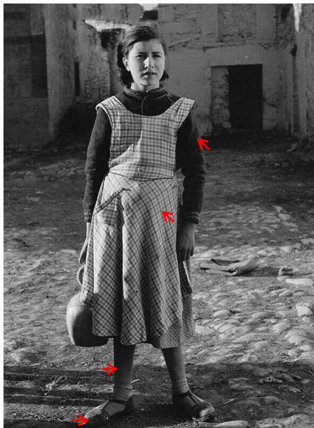
1. Aurora (alternativa)