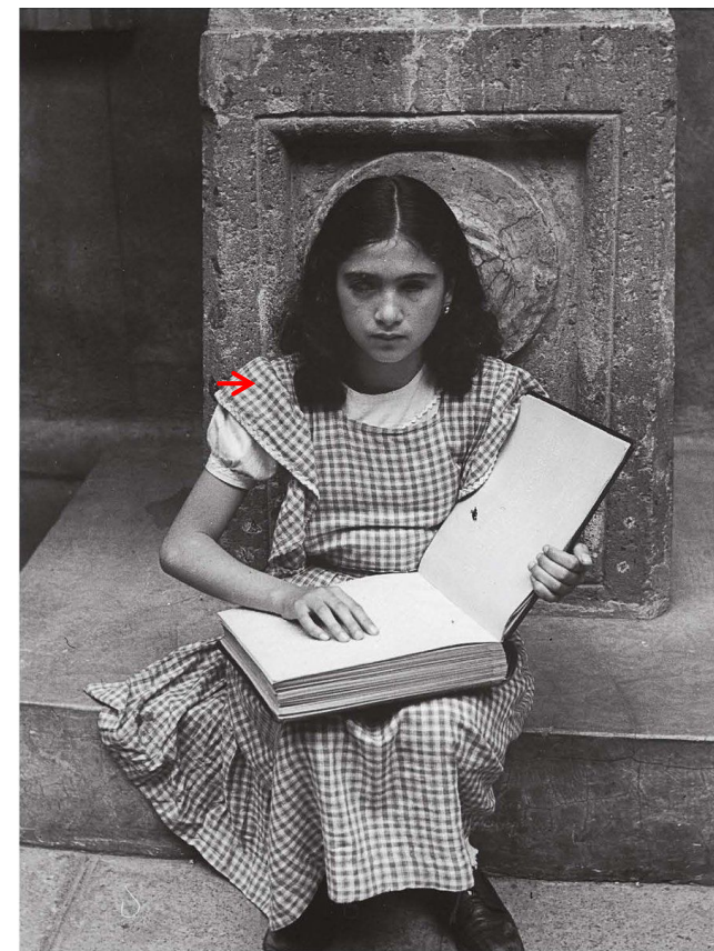
2. Menina (alternativa)