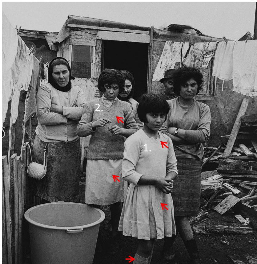
1. Aurora 2. Menina

A MENINA usa roupa campestre: uma camisa escura e larga, saia comprida, meias grossas, botas de couro.