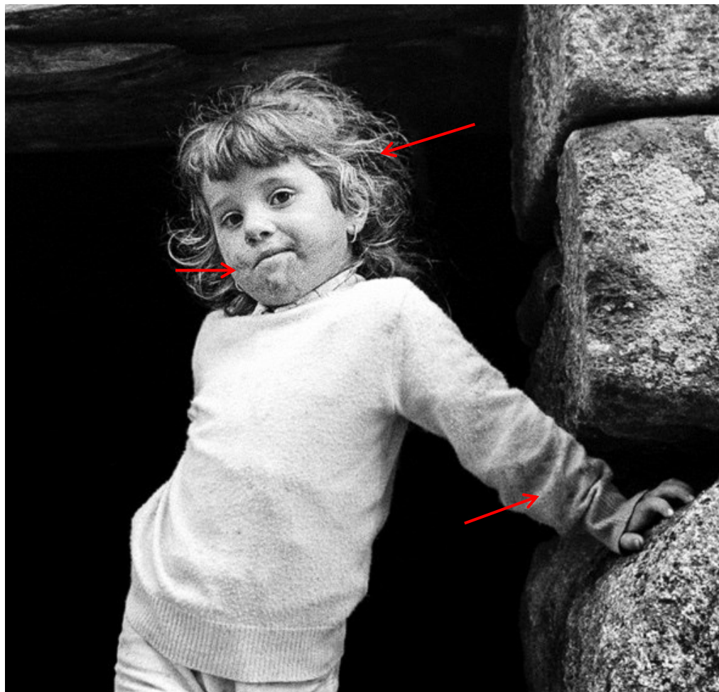
Imagens dos Anos 70 | Portugal