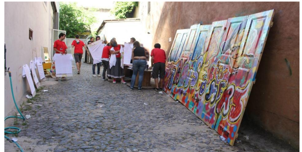
2. TRANSFORMAÇÃO E PINTURA DA ARTA NO DIA T DE 2012 NA ARTA