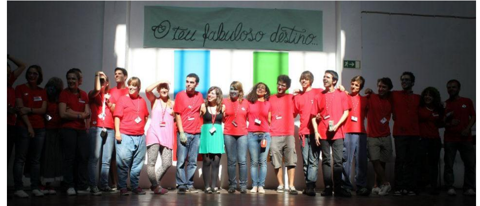
1. FOTO DOS AGRADECIMENTOS DOS TRANSFORMERS NO DIA T DE 2012 NA ARTA