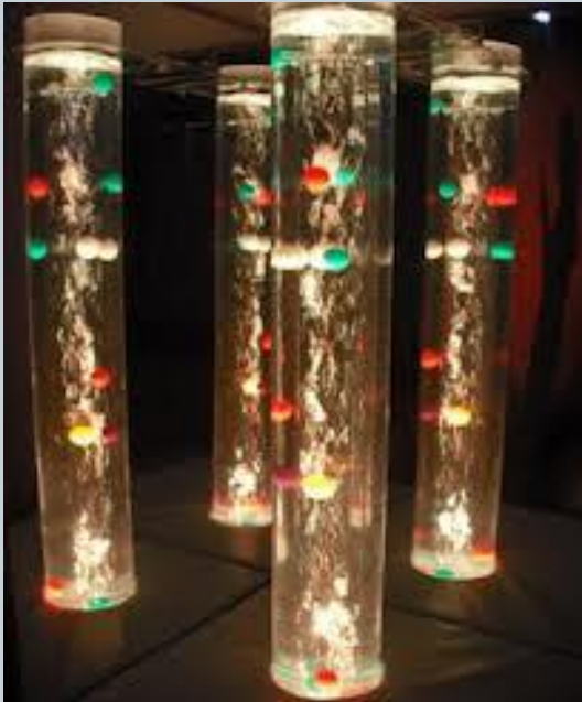
Coluna de água