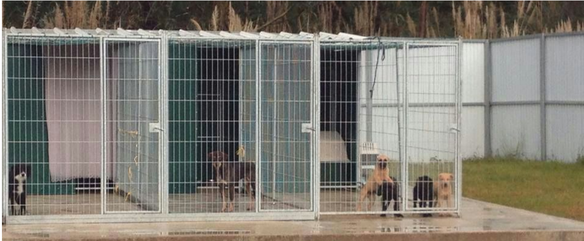
Exemplo de box

Está prevista a existência de 3 zonas de boxes destinadas a canídeos: